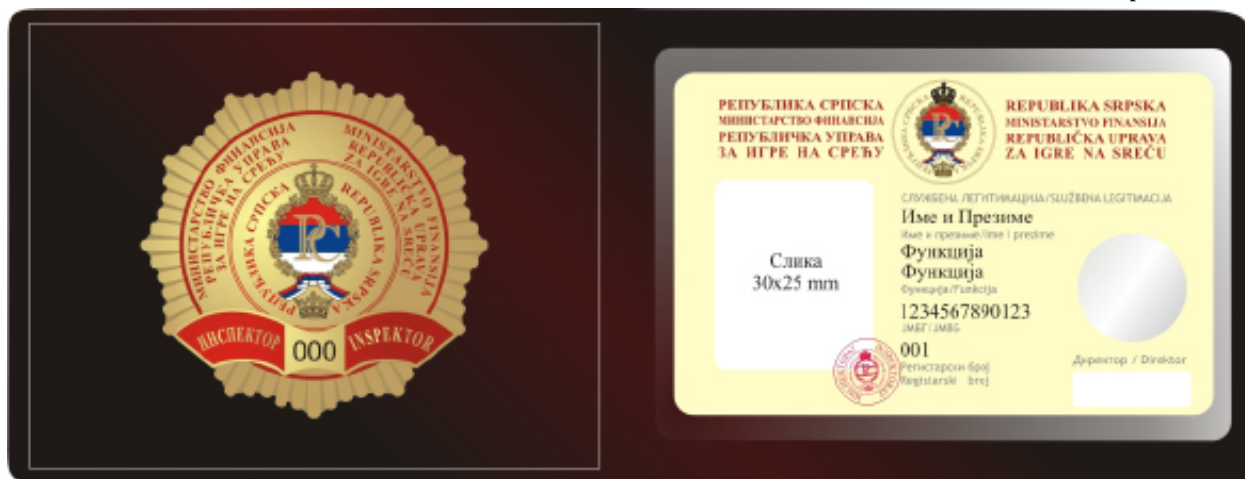
Изглед етуија са значком и службеном легитимацијом