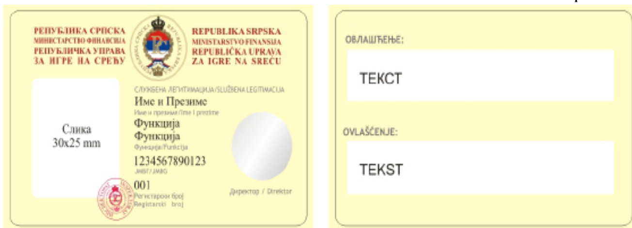
Изглед службене легитимације инспектора Републичке управе за игре на срећу